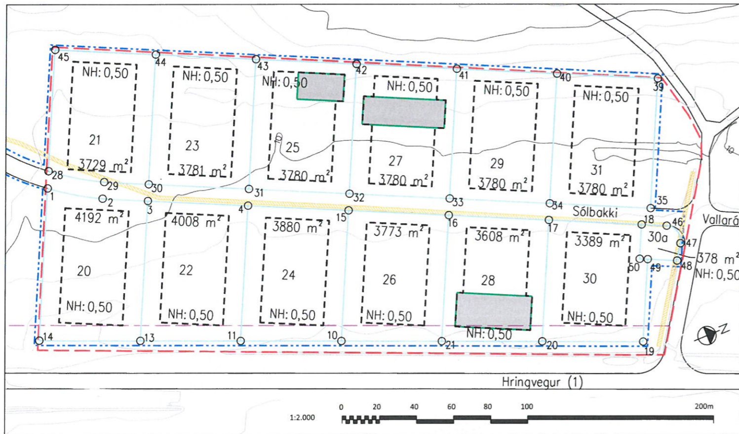
Tillaga að breytingu

V:\08\08255\tekin\U\08255-014 Solbakki deiliskipulag\08255-DS\Kbr Solbakki-UPPDR-2022.dgn